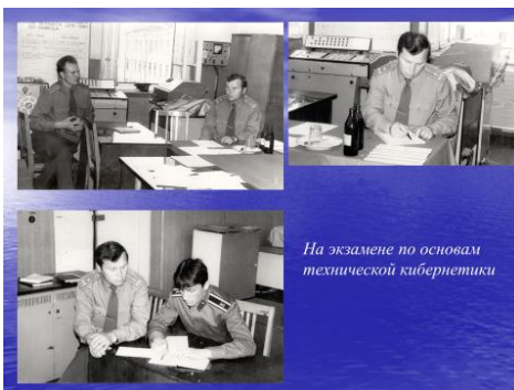
На экзамене по основам технической кибернетики